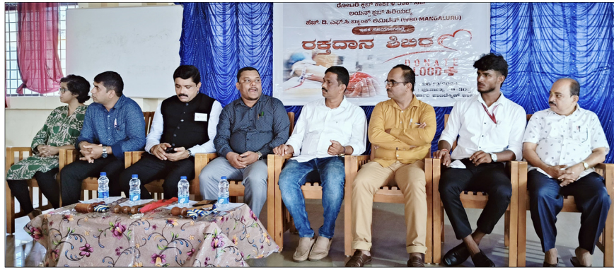
ವಿವಿಧ ಸಂಸ್ಥೆಗಳ ಆಶ್ರಯದಲ್ಲಿ ಕಾರ್ಕಳದ ಪಾಲಿಟೆಕ್ನಿಕ್ ಕಾಲೇಜಿನಲ್ಲಿ ಸ್ವಯಂಪ್ರೇರಿತ ರಕ್ತದಾನ ಶಿಬಿರವು 26-10-2024ರಂದು ನಡೆಸಲಾಯಿತು.