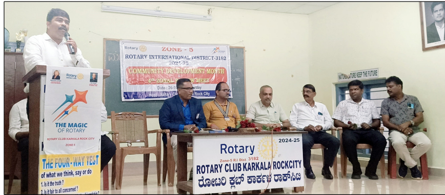
ದಿನಾಂಕ 27-10-2024ರಂದು ನಡೆದ ವಲಯ 5ರ 4ನೇ ವಲಯ ಸಭೆಯಲ್ಲಿ ಕಾರ್ಕಳ ರೋಟರಿ ಸಂಸ್ಥೆಯಿಂದ 6 ಸದಸ್ಯರು ಭಾಗವಹಿಸಿದ್ದರು.