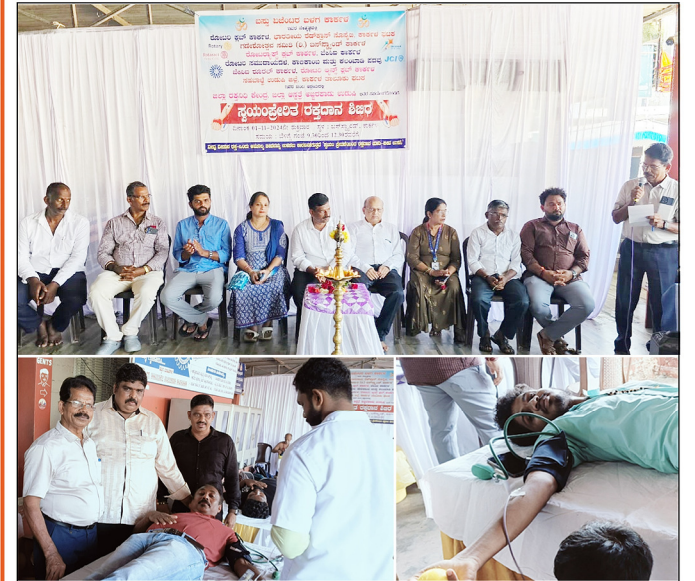
ವಿವಿಧ ಸಂಸ್ಥೆಗಳ ಆಶ್ರಯದಲ್ಲಿ ಸ್ವಯಂಪ್ರೇರಿತ ರಕ್ತದಾನ ಶಿಬಿರವು ದಿನಾಂಕ 01-11-2024ರಂದು ಕಾರ್ಕಳದ ಬಸ್ ಸ್ಟಾಂಡ್‌ನಲ್ಲಿ ಜರಗಿತು.